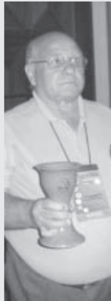
Foto à distância